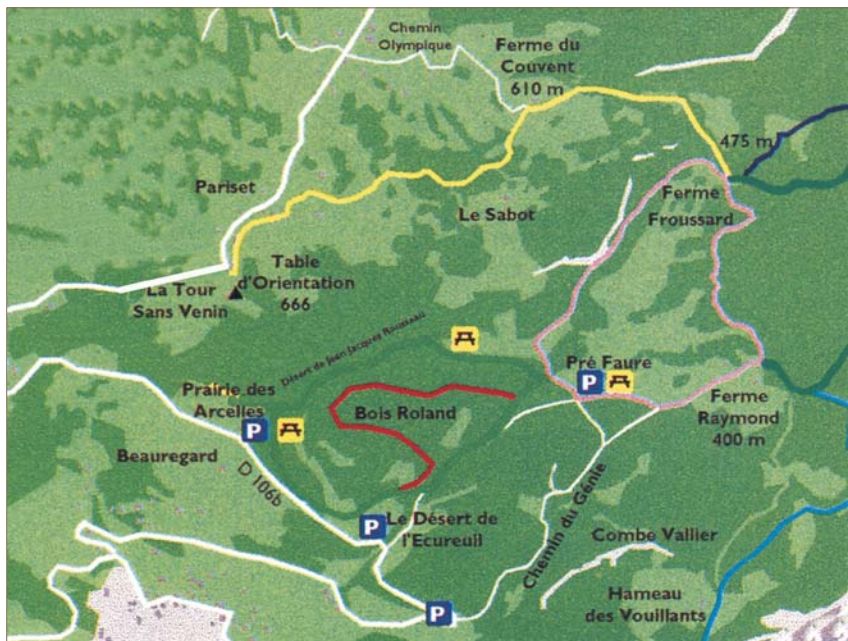
Le tracé jaune matérialise sur le plan ci-dessus l'itinéraire proposé

La ferme du Couvent a été réaménagée par des chantiers jeunes et propose un lieu